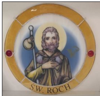
Ryc. 2. Witraż z podobizną św. Rocha.

Kujawsko-Pomorska Izba Lekarsko-Weterynaryjna także czci pamięć św. Rocha poprzez umieszczenie jego podobizny na swoim sztandarze. Ponadto od kilku lat lekarze weterynarii odchodzący na emeryturę otrzymują pamiątkowy witraż z podobizną swojego zawodowego patrona.