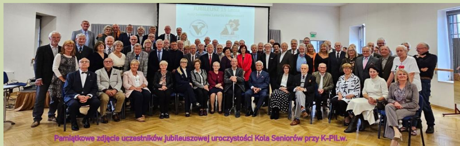
Pamiątkowe zdjęcie uczestników jubileuszowej uroczystości Koła Seniorów przy K-PILW.

przy Kujawsko-Pomorskiej Izbie Lekarsko-Weterynaryjnej Nr 17 (1) / 2024