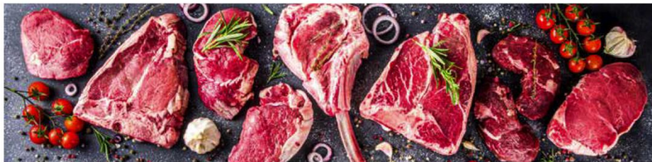
△ Zllique nienimo diosned mostemp erorat exceatqui berferum ea pore pos dolorum hil modipienet res delicta vel et mi, te poria

Wegeaktywiści propagują dietę restrykcyjną jako sposób na ochronę klimatu, ograniczenie zużycia dostępnych zasobów żywności oraz zapewnienie dobrostanu zwierząt. Jednak liczne rekomendacje (np. Amerykańskiej Akademii Żywności i Dietetyki z 2003, 2009 i 2016 roku), uzasadniające zdrowotność tych diet, mają charakter warunkowy i są opatrzone zastrzeżeniem, że „odpowiednio zaplanowane” są zdrowe i odpowiednie dla każdego okresu życia człowieka. Ich zwolennicy jak mantrę powtarzają, że są one zdrowe pod „warunkiem” suplementacji brakujących w diecie składników pokarmowych. Z kolei zaniepokojeni lekarze podkreślają konieczność przeprowadzania częstych (co kilka miesięcy) badań lekarskich, określających czy poziom niedożywienia, szczególnie u dzieci jest jeszcze medycznie akceptowalny.