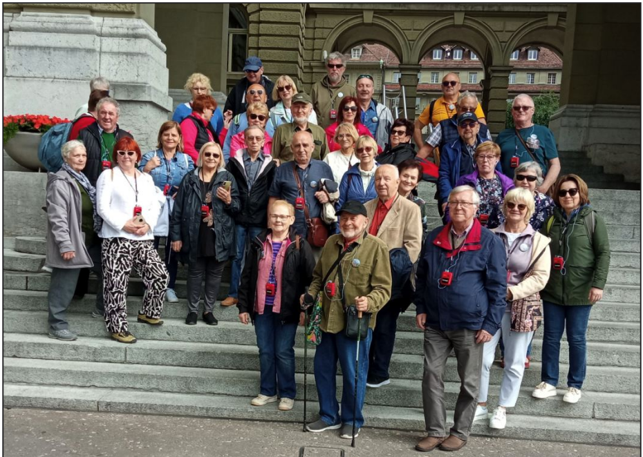
Wybrane zdjęcia z komórki R.T.