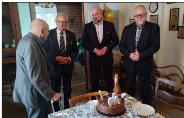
Rozmowa z Jubilatem.