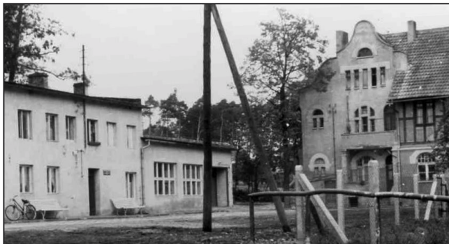
PZLZ Brodnica wraz z budynkiem mieszkalnym