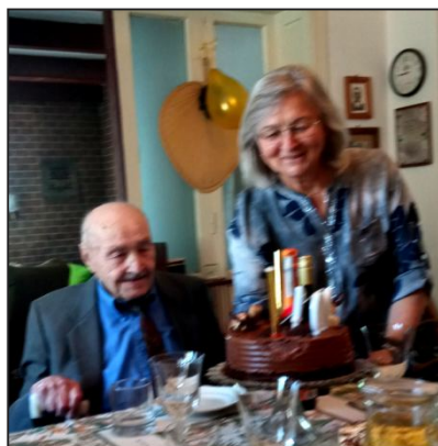
Jubilat z Córką

Skępem, dnia 9 maja 2024 r. w 100 lecie urodzin