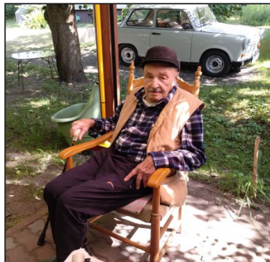
Relaks przed domem w Skępem.